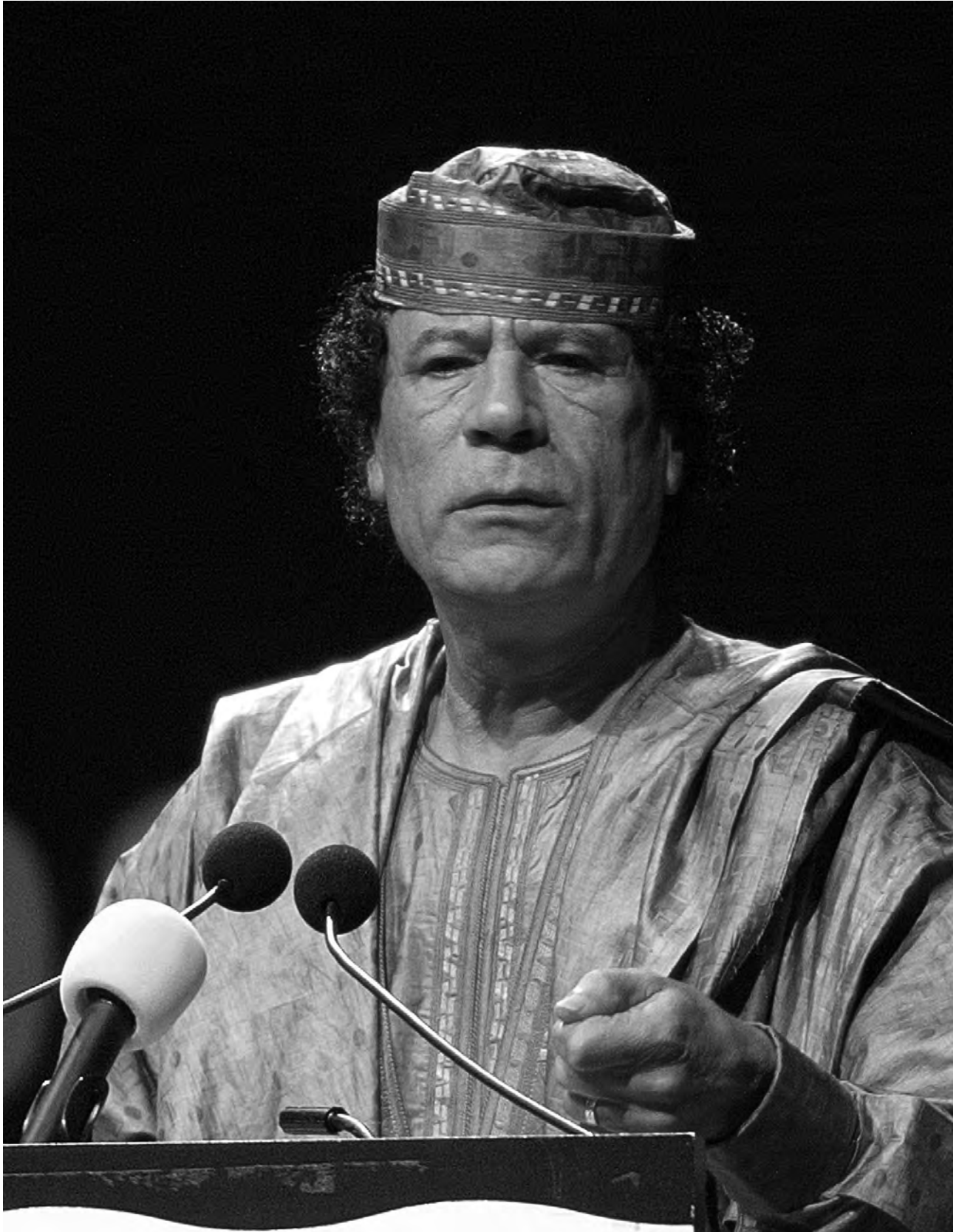
Muammar Qadhafi vid möte i Afrikanska Unionen, Sydafrika 2002.