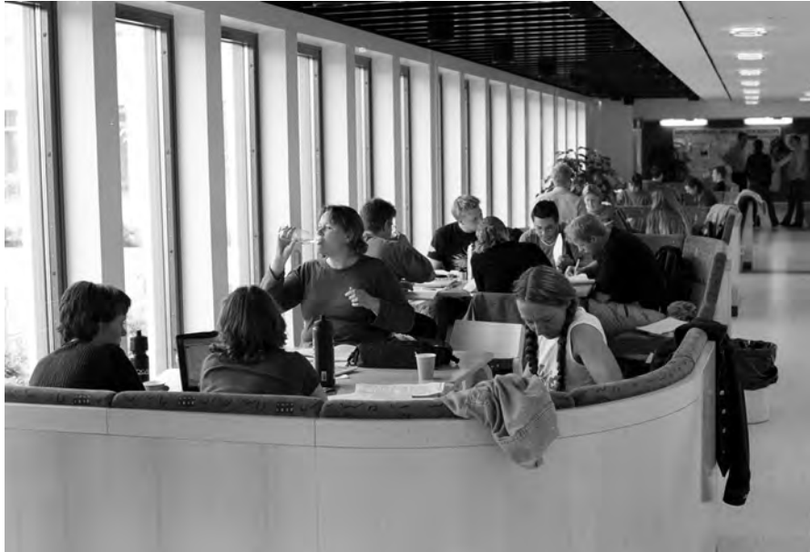
”Retoriken är oändligt värd att studera och oändligt värd att ge våra studenter.” (Studenter från Örebro, foto: Petter Koubek.)