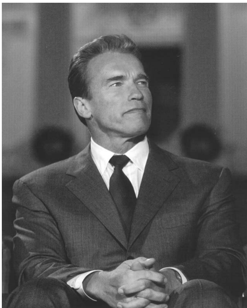
Guvernör Schwarzenegger.

rätt till abort och kontroll av handvapen – tre ståndpunkter som fördöms i konservativa kretsar men är i takt med de kaliforniska väljarnas hållning.